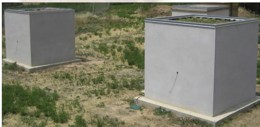
شکل ۱. اتاق‌های تجربی در Puigverd de Lleida (اسپانیا).

ج) خرده‌های لاستیک. ترکیبات مشابه و لایه‌های ضخیم سقف پوزولان، اما استفاده از ۴ سانتی‌متر از خرده لاستیک به‌عنوان مواد لایه زهکشی به‌جای پوزولان- (شکل ۳)